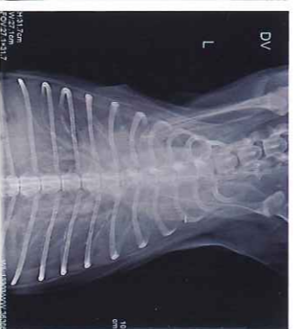
圖二、到院時背腹照