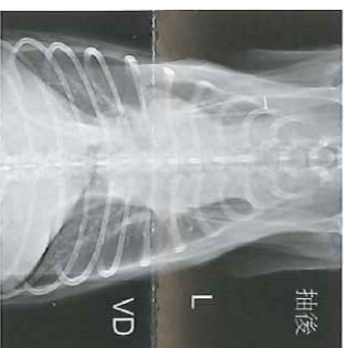
圖四、抽肋膜炎積液後背腹照