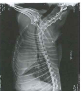
圖一、到院時右側胸