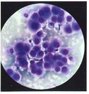
圖十二、肋膜炎積液細胞學型態-