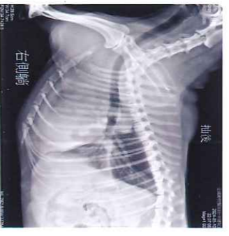
圖三、抽肋膜炎積液後右側胸照