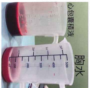
圖十、到院時抽取之心包囊積液及肋膜炎積液(胸水)