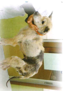
圖集: https://www.petmd.com/dog/skin/dermatology/dog-skin-itches/20140205/36744680012860.jpg 皮屑